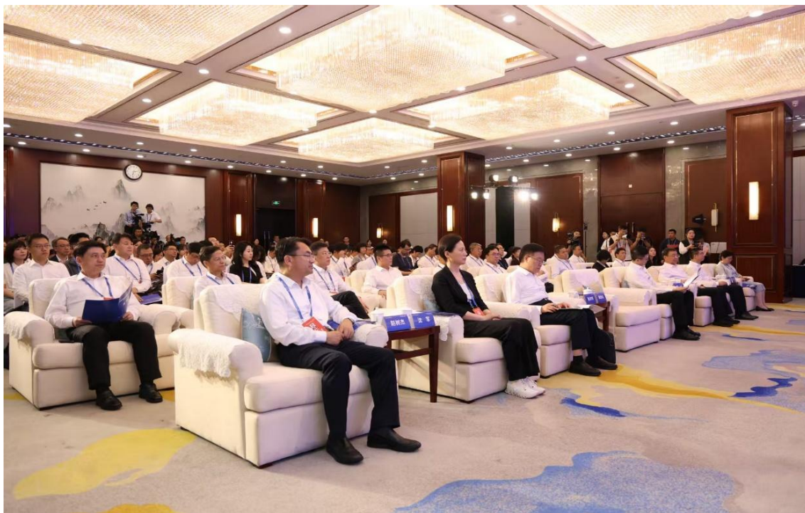
2026 年中国网络文明大会党的创新理论网络传播分论坛现场

主流媒体平台也在努力创造条件，让青年参与表达、参与创造。据现场介绍，近两年，“学习强国”学习平台着力培育“百灵号”创作生态，吸纳了一批优秀的青年创作者参与短视频内容建设，去年累计创作短视频 1.3 万条，总播放量超 40 亿人次；持续建好用好“同学汇”学生工作站，通过主题征文、知识竞答、短视频征集等方式，引导青年在参与中学习理论、传播理论。