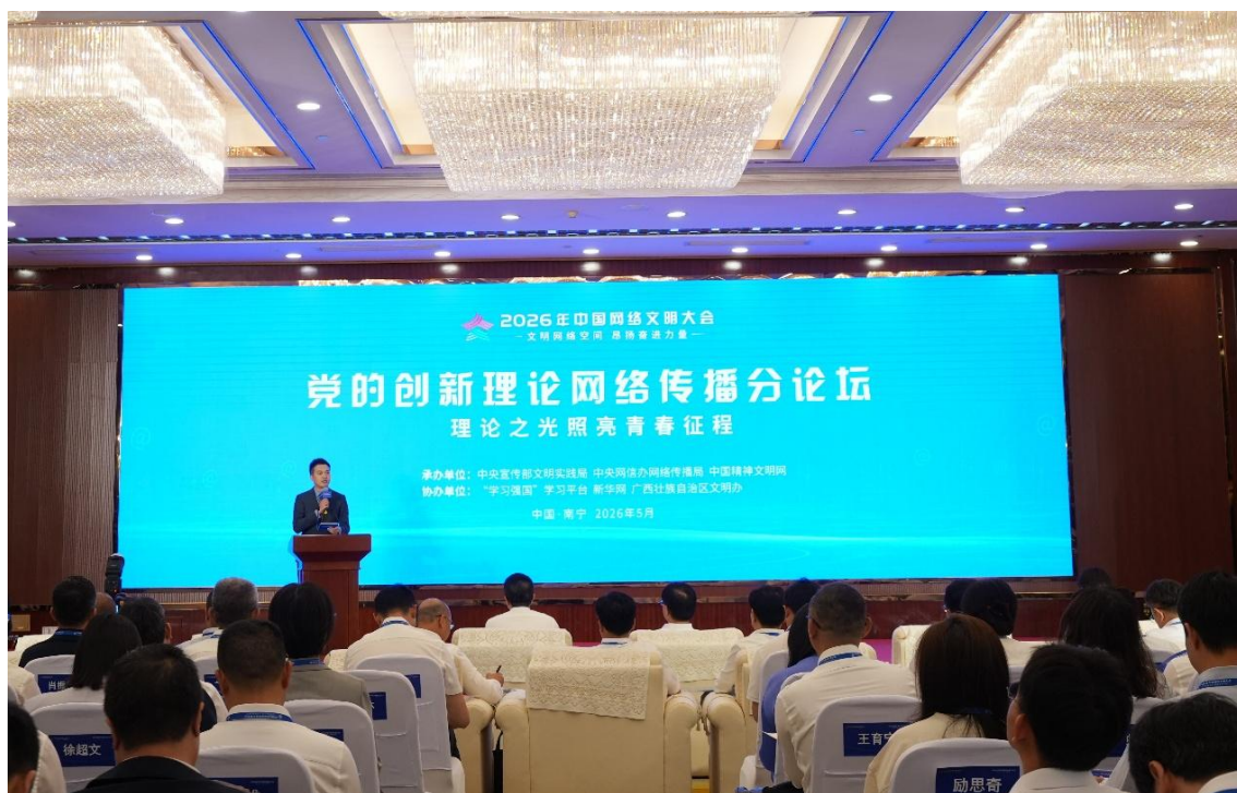
2026年中国网络文明大会党的创新理论网络传播分论坛现场

“学习强国”南宁5月19日电 5月19日,在秀丽的“绿城”南宁,2026年中国网络文明大会党的创新理论网络传播分论坛成功落幕。这场以“理论之光照亮青春征程”为主题的会议,精准锚定新时代青年群体,为理论传播“破圈”指明方向——只有撕掉刻板标签、打破次元壁,让理论作品适配青年的“指尖习惯”,才能让理论实现停留在“指尖”到浸润入“心间”的转变。