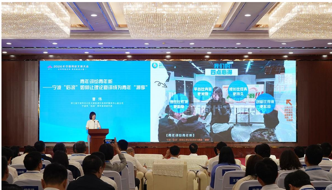
2026年中国网络文明大会党的创新理论网络传播分论坛现场

后’话两会、话三月三、话AI”等一系列融媒体微宣讲，用AI数字人玩说唱的方式“讲活”中国糖都的生态故事……中国移动咪咕公司“新力量”宣讲团队用5G点亮红色文化，用VR带领青年“走进”红色场景，让青年在沉浸式体验中感悟思想力量；等等。